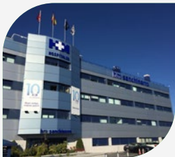
Hospital Madrid Norte Sanchinarro