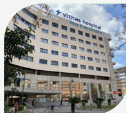
Hospital 9 de Octubre