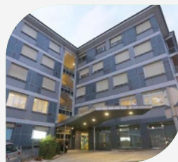
Clínica Virgen Blanca