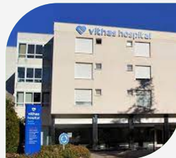
Hospital Vithas Pardo de Aravaca