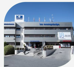
Hospital Madrid Montepríncipe