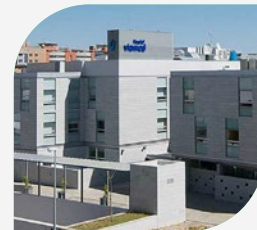
Hospital Viamed Santa Ángela de la Cruz