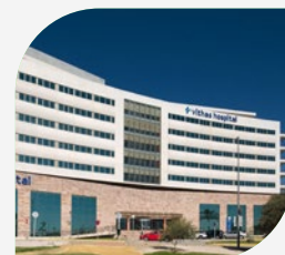
Hospital Vithas Sevilla-Aljarafe